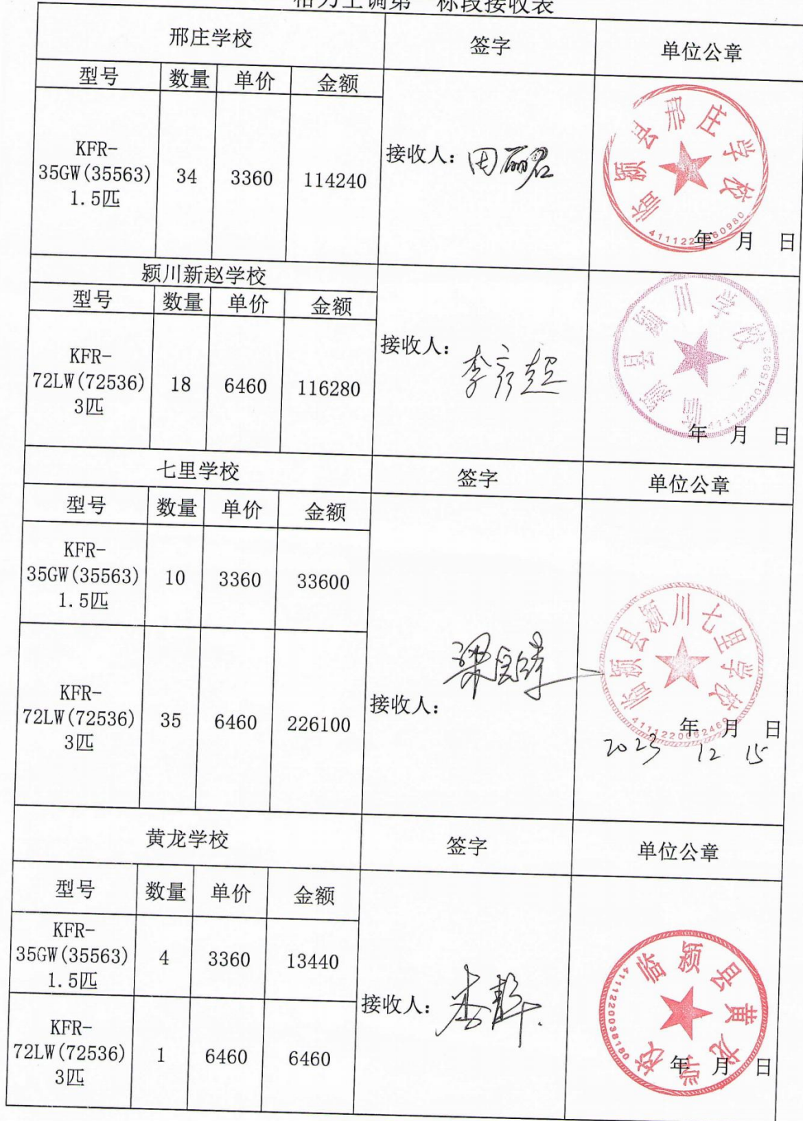
格力空调第一标段接收表